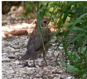
Junge Singdrossel auf Waldweg nach Ettingen